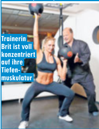
Trainerin Brit ist voll konzentriert auf ihre Tiefenmuskulatur