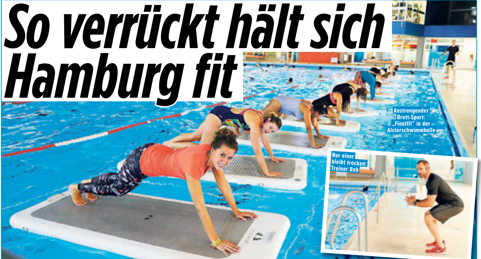
Anstrengender Brett-Sport: „Floatfit“ in der Alsterschwimmhalle